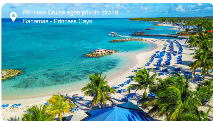
Princess Cruise egen private strand Bahamas - Princess Cays