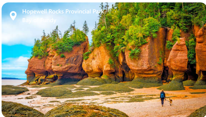
Hopewell Rocks Provincial Park Bay of Fundy

Der er 2 Saint John. Dette er den New brunswick