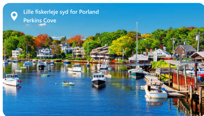
Lille fiskerleje syd for Portland Perkins Cove