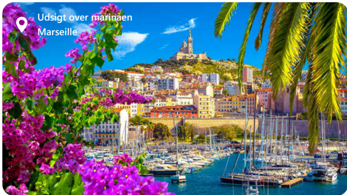
Udsigt over marinaen Marseille