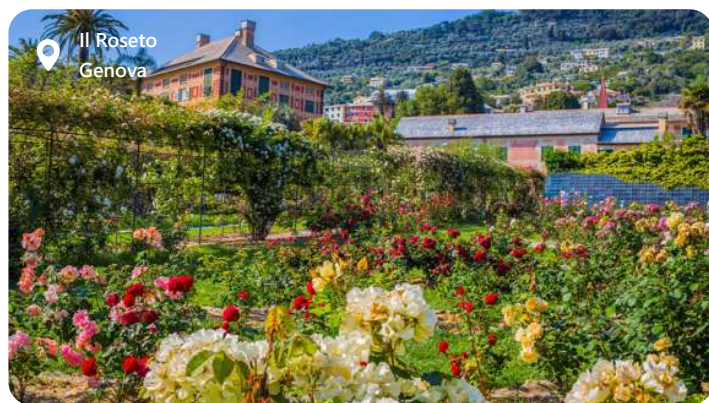
Il Roseto Genova

Genoa er beliggende ved den maleriske Liguriske havkyst i Italien, er en by med en fascinerende historie og kulturel rigdom. Dens gamle havn, en af Middelhavets største, har tjent som et vigtigt knudepunkt for handel i århundreder. Byen er kendt for sin charmerende gamle bydel med smalle brostensbelagte gader, farverige bygninger og imponerende paladser. Genoa er også fødestedet for opdagelsesrejsende Christopher Columbus og byder på et væld af museer, kunstgallerier og en levende kulinarisk scene med lækker ligurisk mad. Med sin unikke blanding af historie, kultur og skønhed er Genoa en uimodståelig destination i Italien.