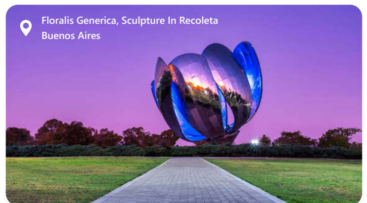
Floralis Generica, Sculpture In Recoleta Buenos Aires

Buenos Aires, Argentinas hovedstad, er en by fyldt med energi og passion. Den er kendt for sin unikke stil og charme. Som kulturelt centrum i Sydamerika er byen kendt for sin blomstrende kunstscene og er hjemsted for mange verdenskendte kunstnere samt en rig historie, der afspejles i dens arkitektur. Se bl.a. Plaza de Mayo, Casa Rosada (regeringspaladset), og La Recoleta, Gå ikke glip af byens tango-shows og dansehaller, hvor besøgende kan opleve den ikoniske dansearter. Der er fantastisk shopping især på Avenida Florida, hvor du finder alt fra designerbutikker til lokale markeder. Rundt om byen findes smukke naturområder som Reserva Ecológica Costanera Sur og Jardín Botánico Carlos Thays.