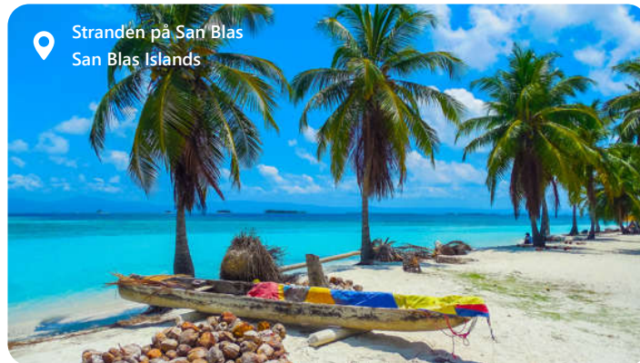
Stranden på San Blas San Blas Islands

Colón er beliggende på den caribiske kyst af Panama ved indgangen til Panamakanalen. Byen spillede en central rolle i opførelsen af kanalen, der blev åbnet i begyndelsen af det 20. århundrede. Besøgende kan se skibene passere gennem sluserne ved Miraflores og Gatun og lære om kanalens historie på besøgscentre. Byen er omgivet af smukke caribiske strande, herunder Playa Grande og Isla Grande, som er populære destinationer for solbadning og vandsport. De er også kendt for sine toldfrie butikker og indkøbscentre. Mest populært er dog den eksotiske øgruppe San Blas.