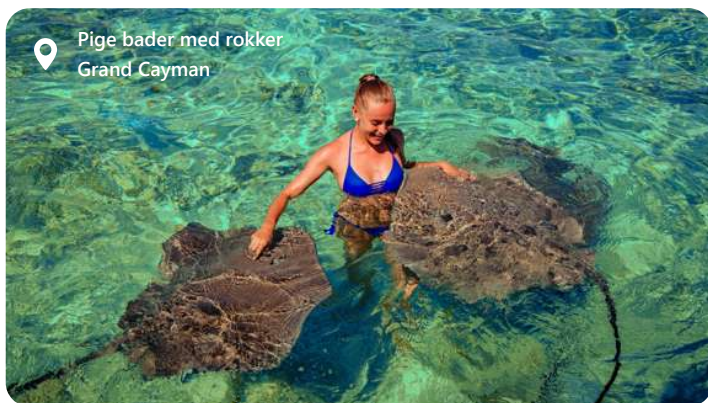
Pige bader med rokker Grand Cayman