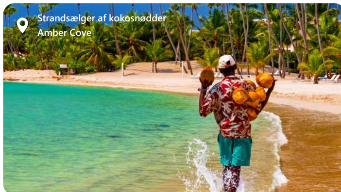
Strandsælger af kokosnødder Amber Cove

Amber Cove er en strålende perle beliggende på den nordlige kyst af Den Dominikanske Republik, tæt på byen Puerto Plata. Denne moderne krydstogthavn, som åbnede i 2015, er udviklet af Carnival Corporation og har hurtigt etableret sig som et af Caribiens mest populære rejsemål for krydstogtspassagerer. Med sin betagende naturlige skønhed, rige kulturhistorie og en bred vifte af aktiviteter er Amber Cove et ideelt sted for en uforglemmelig ferieoplevelse.