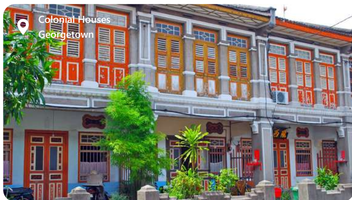
Colonial Houses Georgetown

Georgetown er hjertet af den Malaysiske ø Penang, der er en by, som oses af historie og kultur. Dens brogede gadebillede afspejler sin rige arv som et vigtigt handelsknudepunkt og kolonialt centrum. Besøgende kan udforske de farverige shophouses, templer og gadekøkkener, der pryder byen, og opdage en unik blanding af kinesiske, malaysiske og indiske indflydelser. Georgetown er også kendt for sin gadekunst, der bringer byens mure til liv med kreativitet og fortællinger. Denne charmerende by byder på en uforglemmelig smag af Malaysias kulturarv og en oplevelse, der vækker alle sanser.