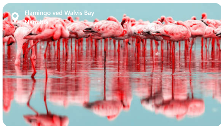
Flamingo ved Walvis Bay Namibia

Walvis Bay er en perle på Namibias atlantehavskyst, som byder besøgende velkommen med sin unikke blanding af ørkenskønhed og maritim charme. Byen er berømt for sin spektakulære naturskønhed, der omfatter ørkenlandskaber, saltpander og det storslåede Pelican Point. Walvis Bay er et paradys for fuglekiggere, da det huser et utal af fuglearter, inklusive de majestætiske flamingoer. Udover sin naturpragt er Walvis Bay også et vigtigt økonomisk knudepunkt, med en travl havn og en blomstrende fiskerisektor. Denne by tilbyder en fascinerende blanding af ørkeneventyr og havliv, der gør den til et unikt rejsemål.