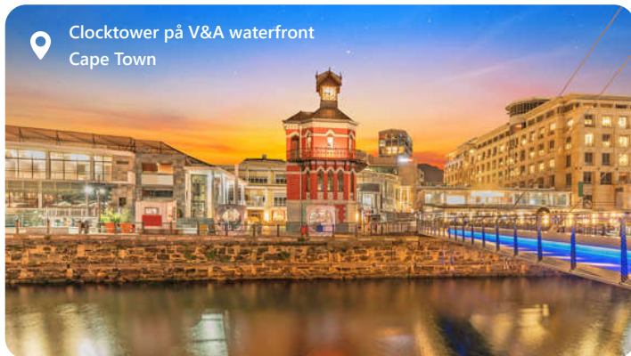
Clocktower på V&A waterfront Cape Town