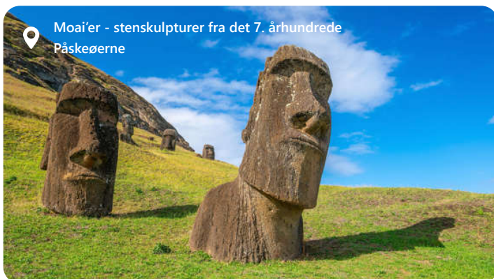
Moaier - stensculpturer fra det 7. århundrede Påskeøerne