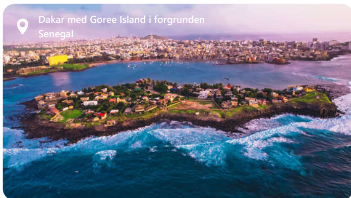
Dakar med Goree Island i forgrunden Senegal