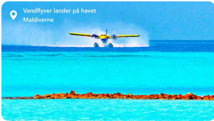
Vandflyver lander på havet Maldiverne