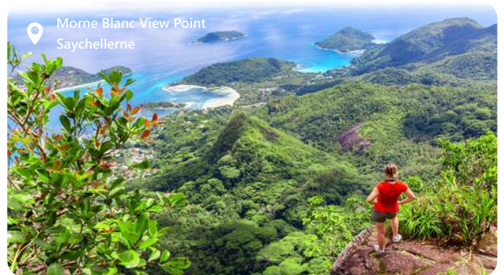
Morne Blanc View Point Seychellerne

Victoria er hovedstaden i Seychellerne, som er en fortryllende juvel i det indiske ocean. Denne lille by, beliggende på øen Mahé, er omgivet af en uforglemmelig skønhed med hvide sandstrande, turkisblåt hav og frodige bjergskrånninger. Victoria byder på en blanding af kulturer, der afspejler øens mangfoldighed og er præget af farverige markeder, historiske monumenter og et sprudlende natteliv. Besøgende kan udforske Seychellernes unikke flora og fauna i omkringliggende naturparker og strande. Victoria er porten til paradys, der kombinerer afslapning med eventyr i en uforglemmelig kulisser.