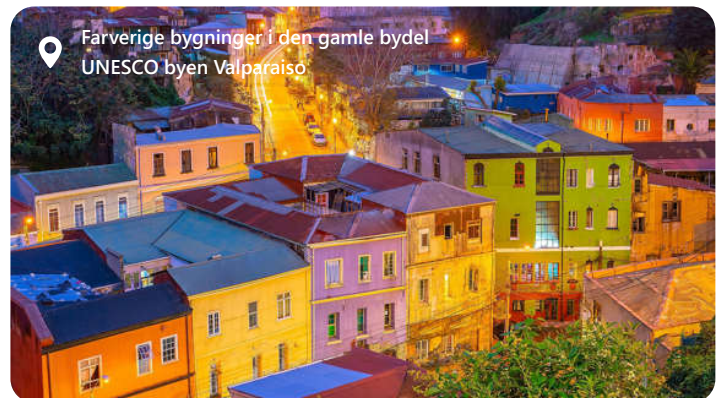
Farverige bygninger i den gamle bydel UNESCO byen Valparaiso

Valparaiso er en malerisk havneby på Chiles Stillehavskyst, er en unik destination fyldt med farver, kultur og historie. Byens karakteristiske træk er dens smukke klippefyldte terræn, farverige huse og stejle bakker. Valparaiso har længe været en kilde til inspiration for kunstnere og forfattere, og dens boheme atmosfære er tydelig i de mange kunstgallerier og kreative værksteder. Byen er også kendt for sin vigtige havnehistorie og for at være et UNESCO-verdensarvsted. Valparaiso byder på en unik kombination af maritim charme og kulturel rigdom, hvilket gør det til et bemærkelsesværdigt rejsemål i Chile.