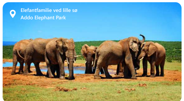
Elefantfamilie ved lille sø Addo Elephant Park

Port Elizabeth, også kendt som "The Friendly City," er en smuk kystby i det sydlige Sydafrika. Algoa Bay imponerer med sine smukke gyldne strande, en malerisk kystlinje og et behageligt klima året rundt. Byen er dynamisk med en rig kulturarv - besøg f.eks. det historiske Donkin Reserve som byder på en flot udsigt fra fyrtårnets top. Eller går en tur på byen fine Boardwalk ved vandet. Her er shopping og restauranter. Men mest besøgt er Addo Elephant National park som ligger 40 km derfra. En absolut fabelagtig oplevelse. Deres er også Kragga Kama game Park med vilde dyr. For de kunstinteresserede anbefales Route 67.... Port Elizabeth har rigeligt til mange dage....og byder velkommen med sin varme atmosfære og imponerende naturskønhed.