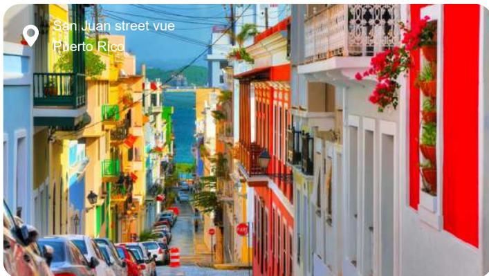
San Juan street vue Puerto Rico

Farverige huse med smedejernsbalkoner, brostensbelagte gader og bymure dækket af klatreplanter - San Juans gamle bydel emmer af kolonitid og caribisk charme. Her kan du gå en tur langs Paseo del Morro og se ud over Atlanterhavet, mens du nærmer dig det mægtige fæstningsværk Castillo San Felipe del Morro, der blev bygget af spanierne i 1500-tallet for at beskytte øen mod pirater. Bag de tykke mure gemmer sig kanoner, udkigstårne og en svimlende udsigt over kysten. Inde i byen lokker små gallerier, caféer og livlige pladser med gadekunst og musik, og i baggrunden står den gamle San Juan-katedral, hvor den spanske opdagelsesrejsende Juan Ponce de León ligger begravet. Vil du lidt uden for byens mure, kan du tage på en kort køretur til regnskoven El Yunque, hvor smalle stier fører dig gennem tågeskov, forbi vandfald og lianer, mens papegøjer og små frøer spiller op fra trækroneerne. Eller du kan kaste dig i bølgerne ved Condado-stranden og mærke den varme brise, som kun Puerto Rico kan levere.