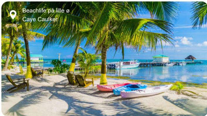
Beachlife på lille ø Caye Caulker