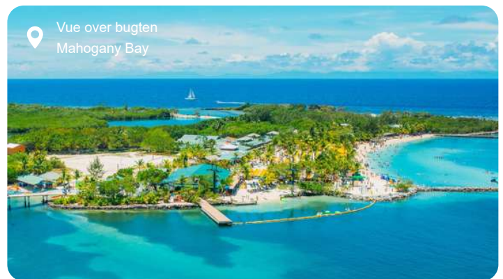
Vue over bugten Mahogany Bay

Mahogany Bay er en charmerende havn på den caribiske ø Roatán, der er en del af Honduras. Beliggende langs øens nordlige kyst, er Mahogany Bay en populær destination for krydstogtskibe og turister, der søger at udforske øens naturskønne skønhed og spændende kultur.