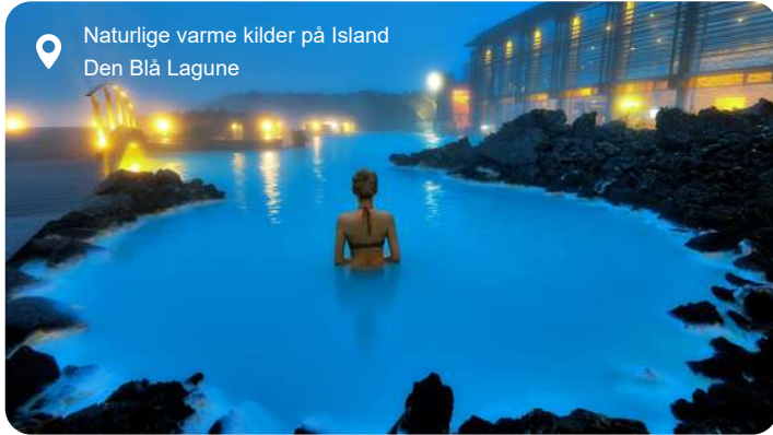
Naturlige varme kilder på Island Den Blå Lagune