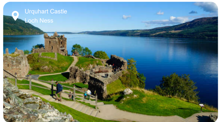
Urquhart Castle Loch Ness

Ved krydstogt til Inverness bliver der lagt til i Invergordon. Inverness er porten til det skotske højland og forener byens rolige charme med de vilde landskabers storhed. Byens hjerte gennemstrømmes af River Ness, hvor du kan spadsere langs flodbredden forbi blomstrende parker, hængebroer og det lyse slot, der troner over byen med udsigt til bjergene i horisonten. I centrum finder du hyggelige pubs, små butikker og det livlige victorianske marked, hvor lokale delikatesser og skotsk uld frister side om side. Et kort stykke udenfor byen venter Loch Ness – den dybe, mørke sø, der er hjemsted for legenden om Nessie, og hvor ruinerne af Urquhart Castle knejser dramatisk over vandet. Du kan også besøge slagmarken ved Culloden, hvor skæbnen for det skotske højland blev beseglet i 1746, eller mærke suset af århundreder i den gådefulde Clava Cairns, stencirkler ældre end Stonehenge. Højlandet omkring Inverness byder på storslåede udsigter, spejlblanke søer og lyngklædte bakker, og du kan tage med på whisky-smagning, se ørne svæve over Glen Affric eller tage en bådture ad Caledonian Canal.