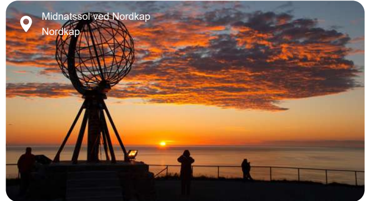
Midnatssol ved Nordkap Nordkap

Måløy ligger som en af Norges vestligste byer, omgivet af fjorde, fjelde og det åbne hav - et sted, hvor naturens kræfter og menneskets stædighed mødes. Den kompakte bymidte ligger på øen Vågsøy og forbindes med fastlandet med en elegant bro, der ofte bades i blæst og bølgesprøjt. Herfra er der ikke langt til nogle af Vestlandets mest særprægede naturoplevelser: Den dramatiske klippekyst ved Kråkenes fyr, hvor stormene raser og havet brøler, og Refviksanden - en bred, næsten kridhvid sandstrand, der uventet åbner sig midt i det ellers barske landskab. Tæt på ligger også Kannesteinen, en særformet klippe skulptureret af havet gennem tusindvis af år og nærmest balancerer på sin smalle fod. I selve byen mærkes sporene af både fiskerihistorie og krigstid; Måløy Raid Center fortæller om den dristige britiske operation i 1941, som satte byen på verdenskortet. Langs havnepromenaden landes stadig friskfanget fisk, og små butikker og caféer vidner om et samfund, der lever tæt på elementerne - men også med stor stolthed. Måløy er ikke en by, man bare passerer. Det er et sted, hvor hav og historie går i clinch, og hvor du får det rå Norge helt ind under huden.