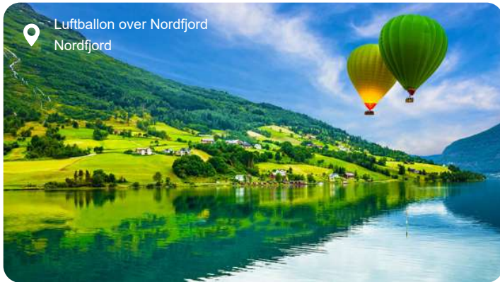
Luftballon over Nordfjord Nordfjord