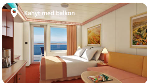
Kahyt med balkon