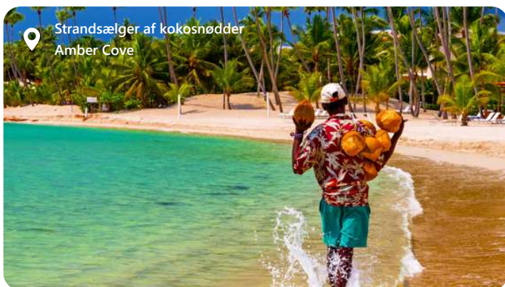
Strandsælger af kokosnødder Amber Cove

byder området også på smukke strande, fiskemuligheder og rekreative aktiviteter. Besøgende kan udforske en spændende blanding af rumfarts- og maritime kulturer og nyde solen, sandet og havnelivet i Port Canaveral.