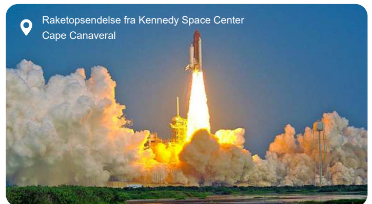
Raketopsendelse fra Kennedy Space Center Cape Canaveral

Port Canaveral summer af solskin, strandliv og eventyr - og lige i nærheden venter nogle af Floridas mest ikoniske oplevelser. Mod syd rejser Kennedy Space Center sig som et monument over rumfartens historie, hvor du kan stå i skyggen af de enorme Saturn V-raketter, gå gennem interaktive udstillinger og mærke spændingen fra en tid, hvor mennesket tog de første skridt mod månen. Lidt længere mod vest lokker Orlando med sine verdensberømte forlystelsesparker, mens kysten omkring Port Canaveral selv byder på afslappet charme. Cocoa Beach er kendt som Floridas surfhovedstad - her trækker surfere deres brætter gennem de lune bølger, og på den lange pier kan du nyde friskfangede rejer eller en skål clam chowder med udsigt over havet. Naturreservaterne i området giver mulighed for at se delfiner, søkøer og havskildpadder i deres naturlige omgivelser, mens Cape Canaveral Lighthouse står som et fast pejlemærke langs den gyldne kyst. Port Canaveral forener teknologi, natur og kyststemning i en dag, der både kan være afslappet og fuld af oplevelser.