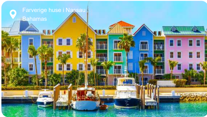
Farverige huse i Nassau Bahamas