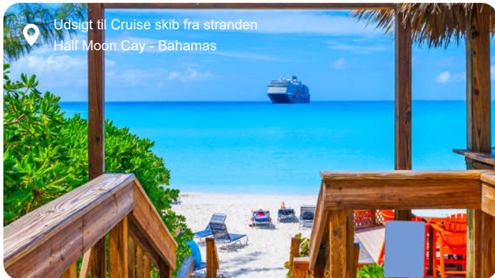
Udsigt til Cruise skib fra stranden Half Moon Cay - Bahamas