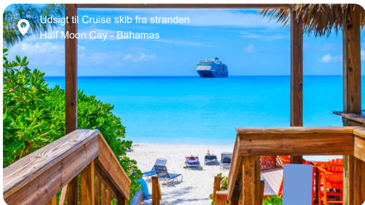
Udsigt til Cruise skib fra stranden Half Moon Cay - Bahamas