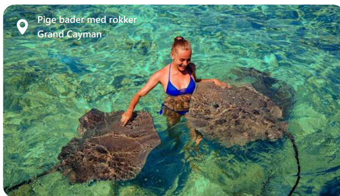
Pige bader med rokker Grand Cayman

Cayman Islands er også kendt for deres smukke strande og klare caribiske hav, som byder på unikke dykkeroplevelser, skildpadde-reservater, snorkle med rokker og skattefri shopping. Med sin blanding af kultur, luksuriøse resorts og naturlig skønhed forbliver Georgetown og Cayman Islands en attraktiv destination for dem, der søger en afslappende tropisk ferieoplevelse.