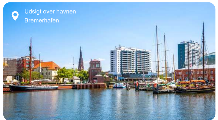
Udsigt over havnen Bremerhafen

Bremerhaven er en by med en rig maritim historie og en moderne tilgang til at udnytte sin havneplacering. Den tilbyder en bred vifte af aktiviteter og attraktioner, der appellerer til både maritime entusiaster og besøgende, der ønsker at udforske byens kulturelle og rekreative muligheder. Bremerhavens "Havenwelten" er et moderne kompleks af rekreative områder, restauranter og attraktioner langs havnen. Byen har en lang historie inden for søfart og skibsbygning. Det er hjemsted for flere maritime museer, hvor besøgende kan udforske Tysklands maritime arv.