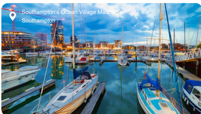
Southampton's Ocean Village Marina Southampton

Southampton har altid været en vigtig havneby i det sydlige England, hvorfor den har været omkranset af tykke bymure som et forsvar mod angribende folk. I dag ses flere velbevarede strækninger af denne mur stadig rundt om det gamle centrum, ligesom flere imponerende porte stadig står. Southampton har også flere gamle bygninger, men ellers er det primært en by for shopping. Smut også forbi den hyggelig pub, Duke of Wellington, der ligger tæt på havnen. En klassisk pub i gammel stil med bindingsværk, blyindfattede ruder, gamle fotografier og en pejs, der tændes på køligere dage. Et perfekt sted at nyde en lager eller et glas ægte cider. Southampton er også et godt udgangspunkt for udflugter. London er f.eks. indenfor rækkevidde, og i den engelske hovedstad venter et utal af seværdigheder så som Tower of London, Big Ben og Buckingham Palace. Der er dog også masser at opleve i det øvrige Sydengland, hvor du kan besøge en eller flere af de historisk interessante byer som f.eks. elegante, romerske Bath, romantiske Winchester med den imponerende katedral og middelalderlige Salisbury med den berømte stensætning Stonehenge.