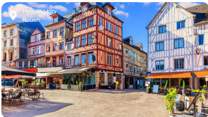
Hyggelig torv Rouen

Le Havre er en moderne og livlig by i Normandiet, hvis bymidte blev genrejst efter Anden Verdenskrig og derfor fremviser en helt særlig moderne arkitektur. Udflugtsmulighederne fra Le Havre er mange og inkluderer typisk ture til den franske hovedstad, Paris, eller landingsstrandene, hvor de amerikanske styrker i sin tid gik i land og var stærkt medvirkende til de allieredes efterfølgende sejr. Normandiets "historiske hovedstad", Rouen, er også en mulighed. Den stemningsfulde, gamle bydel har mere end 700 smukke bindingsværkshuse, et astronomisk ur fra 1500-tallet og den imponerende romersk-katolske katedral, der er Frankrigs højeste kirke. Det var også på byens gamle markedsplads, at Jean d'Arc i sin tid blev brændt på bålet.