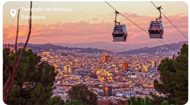
Telegrafic de Montjuic Barcelona

Den catalanske storby Barcelona er Spaniens andenstørste og behøver næppe nogen præsentation. Barcelona har alt, hvad en moderne storby skal have, og mere til. Den er berømt for Gaudis fantasifulde arkitektur, og her vrirler det med seværdigheder som hans finurlige Sagrada Familia og det imponerende fodboldstadion, Camp Nou foruden utallige interessante museer som f.eks. Picassomuseet. Fra Montjuic-bjerget har du en formidabel udsigt over byen, og stemningen på det berømte hovedstrøg, Ramblaen, er i sig selv en oplevelse. Her kan du sagtens få timer til at gå med at betragte menneskemylderet, mens du nyder lækre tapas og boblende cava.