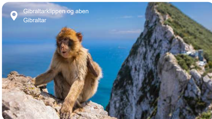
Gibraltarklippen og aben Gibraltar

Gibraltar er et engelsk territorium på Den Iberiske Halvøes sydligste spids. Den ikoniske klippe, The Rock, er selve billedet på Gibraltar, og det er muligt at komme "indenfor" i dens gamle forsvarstunneler. Europas eneste vildtlevende aber møder du også på klippen, og sagnet fortæller, at de er kommet hertil fra Afrika via en underjordisk passage under Gibraltarstrædet, der mandede ud i St. Michaels Grotte, som man længe troede var bundløs. Det er dog ikke tilfældet, og i dag er grotten en stor attraktion, hvor du kan gå rundt mellem de flotte, dramatiske stalagmitter. I den hyggelige by finder du mange butikker og flere charmerende pubber – alt i alt et spøjst lille stykke England blandet med et strejf af Spanien, hvilket giver en helt særlig stemning.