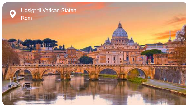
Udsigt til Vatican Staten Rom