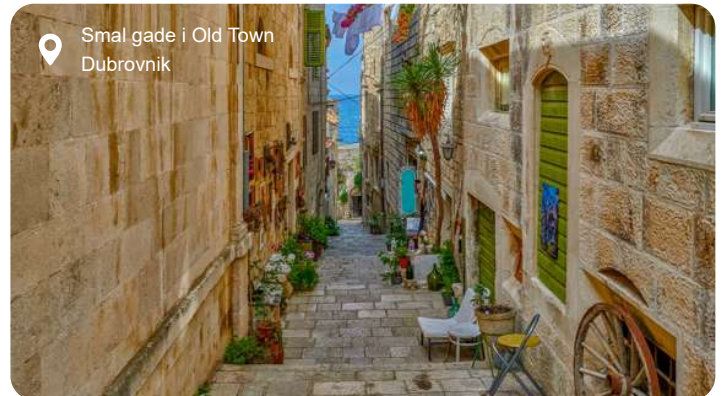
Smal gade i Old Town Dubrovnik

Charmende Dubrovnik ligner med sine honningfarvede stenmure, røde tegltage og glitrende havudsigt noget fra et eventyr. Den smukke gamle bydel, der er fri for trafik, tager næsten vejret fra én med sin helt specielle atmosfære med marmorbelagte gader og flotte bygninger i forskellige stilarter. Rektorens palads fra det 15. århundrede blander f.eks. gotik og renæssance og huser en omfattende samling af malerier, møbler og andre genstande fra de 6 århundreder frem til Napoleons invasion i 1808, hvor Dubrovnik var en selvstændig stat. Gå også en tur på toppen af den imponerende bymur med vagttårnene og oplev den fantastiske udsigt over havet og byens tage. Vil du lidt væk fra folkemængderne, kan du tage en båd til den fredelige ø Lokrum, hvor påfugle går frit omkring, eller nyde udsigten fra bjerget Srd, som kan nås med svævebane.