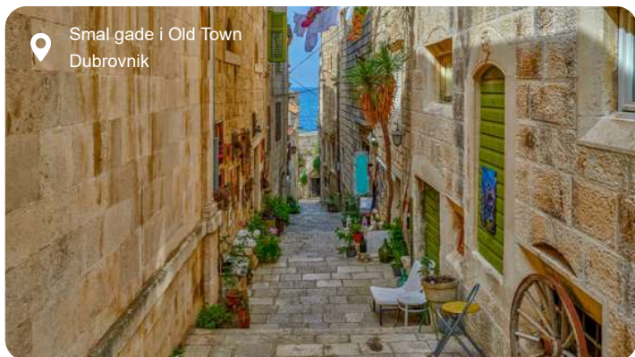
Smal gade i Old Town Dubrovnik