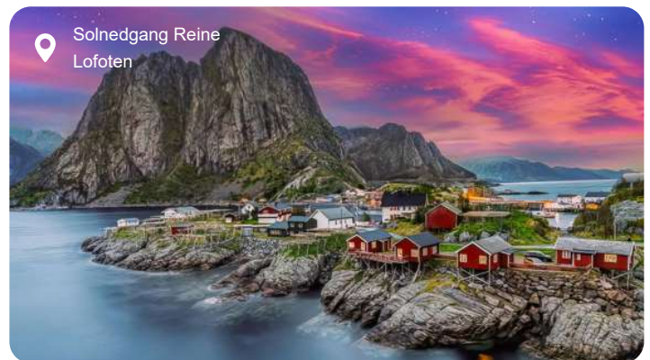
Solnedgang Reine Lofoten

Mellem dramatiske fjelde og turkisblå fjorde ligger Leknes - en lille by midt i Lofoten, hvor naturens storhed aldrig er længere væk end et blik ud ad vinduet. Her mødes du af et landskab, der veksler mellem stejle bjergtinder, hvide sandstrande og grønne enge, hvor får græsser under den åbne himmel. Lofoten er kendt for sine skarptskårne konturer og klare farver, men også for sin lange historie som fiskeområde. I landsbyen Nusfjord, der er en af Norges bedst bevarede, kan du opleve gamle rorbuer, tjærede træbrygger og et levende indblik i livet, som det blev levet for hundrede år siden. En kort tur bringer dig også til Haukland og Uttakleiv, to strande med kridhvidt sand og krystalklart vand, der nærmest minder om sydlige breddegrader - blot omgivet af fjelde i stedet for palmer. Historien mærkes også i Vikingemuseet i Borg, hvor et rekonstrueret langhus fortæller om de høvdinge, der regerede i området for over tusind år siden. Sommeren heroppe byder på midnatssol og lange, gyldne skygger, mens vintermånederne kan overraske med nordlys, der danser hen over himlen. Uanset årstid føles Leknes som en pause fra verden - et sted, hvor stilheden har klang, og hvor naturens storhed er både nærværende og uforglemmelig.