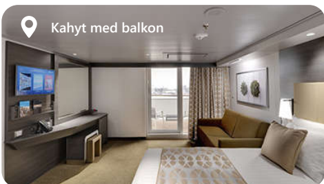
Kahyt med balkon

OB - Udvendig Bella, Uspecificeret OL2 - Udvendig Fantastica, Premium OM2 - Udvendig Fantastica, junior OO - Udvendig Fantastica, med begrænset udsigt OR1 - Udvendig Fantastica, Deluxe