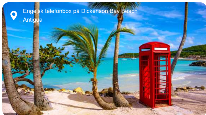
Engelsk telefonbox på Dickenson Bay Beach Antigua

Farverige træhuse med udskårne verandaer, afskallede facader og bliktag i rødt og turkis sætter kulør på St. John's, Antiguas lille, livlige hovedby. Byens centrum er overskueligt og levende, og her finder du både kolonihistoriske bygninger og små lokale museer, som giver et indblik i øens britiske arv og afrocaribiske kultur. I havnen ligger farverige fiskerbåde side om side med store krydstogtskibe, og fra den lille promenade er der udsigt over Det Caribiske Havs klare blå nuancer. Ikke langt fra byen ligger nogle af Antiguas største seværdigheder: Nelson's Dockyard i English Harbour er en velbevaret flådebase fra 1700-tallet, hvor du kan gå mellem gamle stenhuse og mastekraner og få et glimt af livet under Royal Navy. Området er på UNESCO's verdensarvsliste og oser af maritim historie. Kører du videre op ad bjergvejene, når du til Shirley Heights, der er en tidligere udkigspost med storslået udsigt over bugten og havet. Øen er kendt for sine mange strande - faktisk én for hver dag i året, som man siger - og du finder alt fra stille laguner til strækninger med bølger og liv. Antigua er rig på historie, men det er også en ø, hvor rytmen er afslappet, og naturen altid lige om hjørnet.