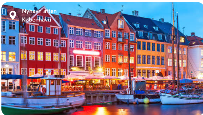
Nyhavn aften København