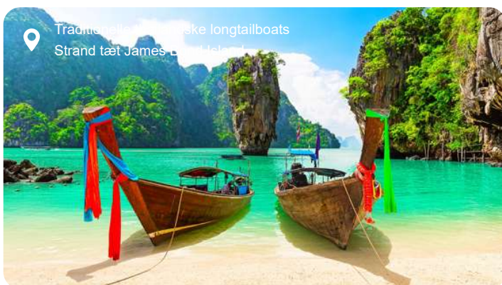
Traditionelle thailandske longtailboats Strand tæt James Bond Island