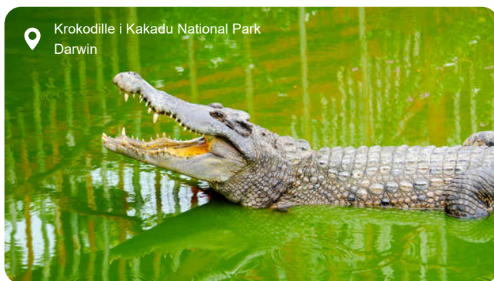
Krokodille i Kakadu National Park Darwin

Tæt på ækvator og alligevel umiskendeligt australsk ligger Darwin som en tropisk og afslappet by, hvor regnskov, mangrover og røde klipper møder moderne caféer og markeder med smag af Asien. Her er himlen høj og lyset skarpt, og i parkerne høres kakaduer og cikader i fælleskoncert. Byens historie bærer på både drama og modstandskraft: Først ødelagt af japanske bomber under Anden Verdenskrig og senere af cyklonen Tracy i 1974. I dag rejser Darwin sig som et levende bevis på overlevelse og nytænkning. I museerne kan du fordybe dig i krigshistorien, i aboriginernes rige kultur og i stormens hærgen, mens havnefronten indbyder til afslapning blandt skulpturer, saltvandspools og udsigt til Timorhavet. En udflugt til det nærliggende Kakadu-område giver et sjældent indblik i Australiens vilde natur - her lever krokodiller, wallabies og et rigt fugleliv mellem kløfter, vådområder og ældgamle klippemalerier. Også Litchfield National Park ligger inden for rækkevidde og lokker med imponerende vandfald, naturlige badehuller og de karakteristiske termitboer, der står som skulpturer i landskabet. Alt i alt en blanding af rå natur og menneskelig udholdenhed, hvor varme, vildskab og venlighed går hånd i hånd.