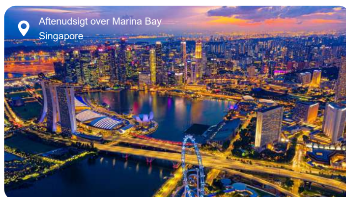
Aftenudsigt over Marina Bay Singapore

Singapore er en storby og et land i ét. Den hektiske men fantastiske metropol er en skøn blanding af gammelt og nyt. Flotte bygninger som det historiske parlament og nationalmuseet, orkidéhaven – der er den eneste tropiske have på UNESCO's verdensarvsliste – smukke templer og kulturelt varierende bydele er noget af alt det, Singapore har at byde på. Fra taget af det ikoniske hotel, Marina Bay Sands, har du en eminent udsigt over store dele af byen, og i nærliggende Gardens by the Bay rejser de gigantiske fantastræer sig som noget fra en anden verden, mens den kølige Cloud Forest-kuppel byder på et brusende indendørs vandfald. I hjertet af Singapore ligger Chinatown med røde lanterner og duften af street food, mens det charmerende arabiske kvarters gader er fyldt med små butikker og en kunstnerisk og hip stemning. Den imponerende Sultan Moské er bygget af både guld og sojaflasker! På det berømte Raffles Hotel blev Singapore Sling cocktailen opfundet, og den kan nydes i hotellets Long Bar sammen med de klassiske jordnødder, hvis skaller du – traditionen tro – bare smider på gulvet.