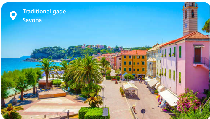
Traditionel gade Savona