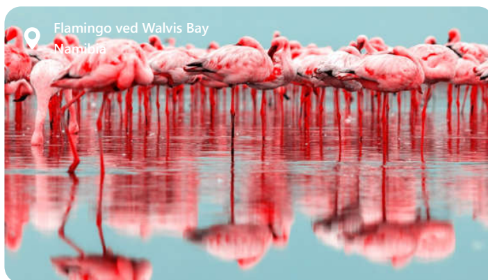
Flamingo ved Walvis Bay Namibia

Walvis Bay er en perle på Namibias atlantehavskyst, som byder besøgende velkommen med sin unikke blanding af ørkenkønhed og maritim charme. Byen er berømt for sin spektakulære naturskønhed, der omfatter ørkenlandskaber, saltpander og det storslåede Pelican Point. Walvis Bay er et paradys for fuglekiggere, da det huser et utal af fuglearter, inklusive de majestætiske flamingoer. Udover sin naturpragt er Walvis Bay også et vigtigt økonomisk knudepunkt, med en travl havn og en blomstrende fiskerisektor. Denne by tilbyder en fascinerende blanding af ørkeneventyr og havliv, der gør den til et unikt rejsemål.