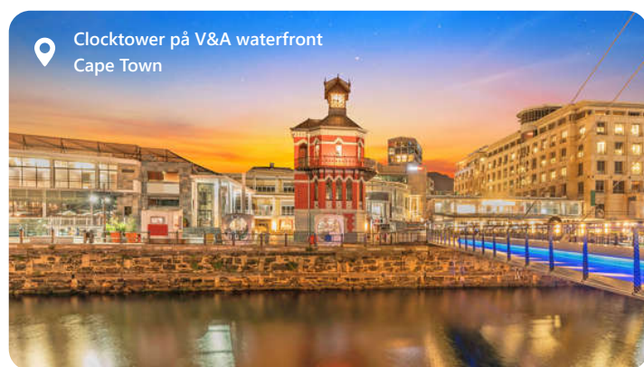
Clocktower på V&A waterfront Cape Town