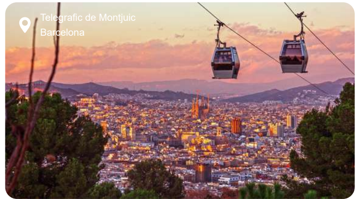
Telegrafic de Montjuic Barcelona

Den catalanske storby Barcelona er Spaniens andenstørste og behøver næppe nogen præsentation. Barcelona har alt, hvad en moderne storby skal have, og mere til. Den er berømt for Gaudis fantasifulde arkitektur, og her vrirler det med seværdigheder som hans finurlige Sagrada Familia og det imponerende fodboldstadion, Camp Nou foruden utallige interessante museer som f.eks. Picassomuseet. Fra Montjuic-bjerget har du en formidabel udsigt over byen, og stemningen på det berømte hovedstrøg, Ramblaen, er i sig selv en oplevelse. Her kan du sagtens få timer til at gå med at betragte menneskemylderet, mens du nyder lækre tapas og boblende cava.