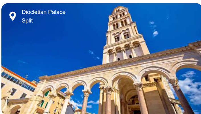
Diocletian Palace Split

Den livlige, kroatisk kulturby Splits fortryllende, gamle bykerne kan spore sine rødder tilbage til Antikken, hvor Split var under romersk herredømme. Her forenes fortid og nutid med romerske paladser på den ene side og moderne arkitektur og butikker på den anden. Omdrejningspunktet i den gamle bydel er den romerske kejser Diocletians palads med 16 tårne og 3 templer fra år 295. Paladset er siden ombygget og tilpasset flere gange af efterkommende herskere og ligger i dag meget tæt på Rivaen – den pulserende og fashionable, palmefyldte gade ved vandet, hvor du finder butikker og caféer og kan beskue det lokale liv. Yndede udfugtsmål fra Split inkluderer de gamle byer Solin og Trogir med mange levn fra Antikken og Krka Nationalpark med smukke vandfald, vandmøller og betagende landskaber.