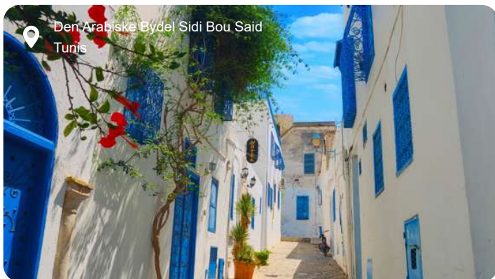
Den Arabiske Bydel Sidi Bou Said Tunis

La Goulette fungerer som havn for den tunesiske hovedstad, Tunis, og der er blot ca. 12 km imellem de to. Dermed er det let at komme ind til Tunis med taxi på egen hånd. Selvom du her i Nordafrika befinder dig i en anden verden og kultur, så har byen efterhånden også en del vestlige træk. Tunis er delt op i Medinaen og Ville Nouvelle, som er henholdsvis den gamle og nye bydel, og der er stor forskel på de to dele. Af fremtrædende bygningsværker kan nævnes den katolske katedral og Hotel du Lac, der mest af alt minder om en flad pyramide vendt på hovedet. Medinaen er mere fremmedartet og eventyragtig og som sådan mere interessant for mange nordboere. Den er Tunis' historiske hjerte og fyldt med sightseeing-potentiale. Den er en labyrint af smalle, snoede gader på kryds og tværs, der gemmer på både moskeer, mausoleer, koranskoler og selvfølgelig souken, som er det lokale marked, der nærmest er en lille by i sig selv. For historieinteresserede er det et must at besøge Karthago, der er uløseligt forbundet med Oldtidens Puniske Krige og Hannibals krigselefanter. Du finder også en verdensberømt mosaiksamling på Bardomuseet og en bohème-stemning i maleriske Sidi Bou Said.