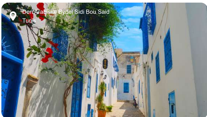
Den Arabiske Bydel Sidi Bou Said Tunis

La Goulette fungerer som havn for den tunesiske hovedstad, Tunis, og der er blot ca. 12 km imellem de to. Dermed er det let at komme ind til Tunis med taxi på egen hånd. Selvom du her i Nordafrika befinder dig i en anden verden og kultur, så har byen efterhånden også en del vestlige træk. Tunis er delt op i Medinaen og Ville Nouvelle, som er henholdsvis den gamle og nye bydel, og der er stor forskel på de to dele. Af fremtrædende bygningsværker kan nævnes den katolske katedral og Hotel du Lac, der mest af alt minder om en flad pyramide vendt på hovedet. Medinaen er mere fremmedartet og eventyragtig og som sådan mere interessant for mange nordboere. Den er Tunis' historiske hjerte og fyldt med sightseeing-potentiale. Den er en labyrint af smalle, snoede gader på kryds og tværs, der gemmer på både moskeer, mausoleer, koranskoler og selvfølgelig souken, som er det lokale marked, der nærmest er en lille by i sig selv. For historieinteresserede er det et must at besøge Karthago, der er uløseligt forbundet med Oldtidens Puniske Krige og Hannibals krigselefanter. Du finder også en verdensberømt mosaiksamling på Bardo-museet og en bohème-stemning i maleriske Sidi Bou Said.