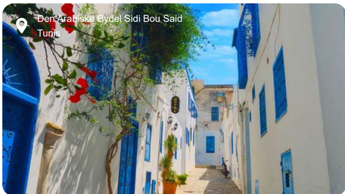
Den Arabiske Bydel Sidi Bou Said Tunis

La Goulette fungerer som havn for den tunesiske hovedstad, Tunis, og der er blot ca. 12 km imellem de to. Dermed er det let at komme ind til Tunis med taxi på egen hånd. Selvom du her i Nordafrika befinder dig i en anden verden og kultur, så har byen efterhånden også en del vestlige træk. Tunis er delt op i Medinaen og Ville Nouvelle, som er henholdsvis den gamle og nye bydel, og der er stor forskel på de to dele. Af fremtrædende bygningsværker kan nævnes den katolske katedral og Hotel du Lac, der mest af alt minder om en flad pyramide vendt på hovedet. Medinaen er mere fremmedartet og eventyragtig og som sådan mere interessant for mange nordboere. Den er Tunis' historiske hjerte og fyldt med sightseeing-potentiale. Den er en labyrint af smalle, snoede gader på kryds og tværs, der gemmer på både moskeer, mausoleer, koranskoler og selvfølgelig souken, som er det lokale marked, der nærmest er en lille by i sig selv. For historieinteresserede er det et must at besøge Karthago, der er uløseligt forbundet med Oldtidens Puniske Krige og Hannibals krigselefanter. Du finder også en verdensberømt mosaiksamling på Bardomuseet og en bohème-stemning i maleriske Sidi Bou Said.