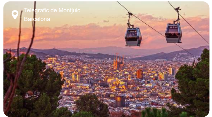
Telegrafic de Montjuic Barcelona

Den catalanske storby Barcelona er Spaniens andenstørste og behøver næppe nogen præsentation. Barcelona har alt, hvad en moderne storby skal have, og mere til. Den er berømt for Gaudis fantasifulde arkitektur, og her vrirler det med seværdigheder som hans finurlige Sagrada Familia og det imponerende fodboldstadion, Camp Nou foruden utallige interessante museer som f.eks. Picassomuseet. Fra Montjuic-bjerget har du en formidabel udsigt over byen, og stemningen på det berømte hovedstrøg, Ramblaen, er i sig selv en oplevelse. Her kan du sagtens få timer til at gå med at betragte menneskemylderet, mens du nyder lækre tapas og boblende cava.