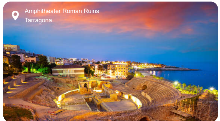
Amfiteater Roman Ruins Tarragona

I Tarragona falder Middelhavets lys på ruiner fra Romerriget og giver historien en nærmest fysisk tilstedeværelse. Midt i byen ligger resterne af amfiteatret, hvor gladiatører engang kæmpede med havet som bagtæppe, og tæt ved står den store akvædukt Pont del Diable, der stadig spænder sin bue over dalen med imponerende præcision. I den middelalderlige bydel snor smalle gader sig mellem bagerduft og kaffe, og små pladser folder sig ud med springvand og caféborde i skyggen. Katedralens gotiske facade rejser sig over byens tage, og bag murene gemmer klostergården på århundreders håndværk i sine fint udskårne kapitæler. Nede ved havnen summer strandpromenaden af liv, og Platja del Miracle - Mirakelstranden -ligger kun få skridt fra de gamle ruiner. Lidt længere nede ad kysten finder du den gamle fiskerbydel El Serrallo, hvor dagens fangst stadig landes og serveres på små, enkle restauranter som et levende minde om Tarragonas maritime rødder.