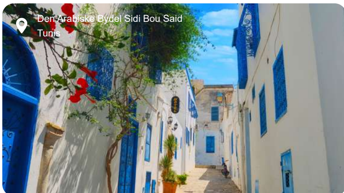
Den Arabiske Bydel Sidi Bou Said Tunis

La Goulette fungerer som havn for den tunesiske hovedstad, Tunis, og der er blot ca. 12 km imellem de to. Dermed er det let at komme ind til Tunis med taxi på egen hånd. Selvom du her i Nordafrika befinder dig i en anden verden og kultur, så har byen efterhånden også en del vestlige træk. Tunis er delt op i Medinaen og Ville Nouvelle, som er henholdsvis den gamle og nye bydel, og der er stor forskel på de to dele. Af fremtrædende bygningsværker kan nævnes den katolske katedral og Hotel du Lac, der mest af alt minder om en flad pyramide vendt på hovedet. Medinaen er mere fremmedartet og eventyragtig og som sådan mere interessant for mange nordboere. Den er Tunis' historiske hjerte og fyldt med sightseeing-potentiale. Den er en labyrint af smalle, snoede gader på kryds og tværs, der gemmer på både moskeer, mausoleer, koranskoler og selvfølgelig souken, som er det lokale marked, der nærmest er en lille by i sig selv. For historieinteresserede er det et must at besøge Karthago, der er uløseligt forbundet med Oldtidens Puniske Krige og Hannibals krigselefanter. Du finder også en verdensberømt mosaiksamling på Bardomuseet og en bohème-stemning i maleriske Sidi Bou Said.