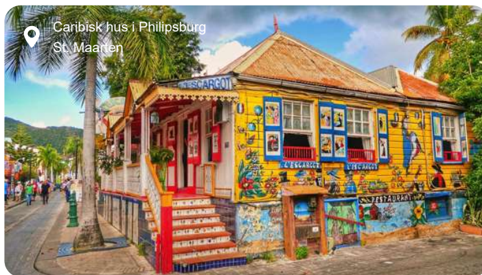
Caribisk hus i Philipsburg St. Maarten

Farvestrålende huse i kolonistil, glitrende butikker og turkisblåt hav danner rammen om Philipsburg, hovedbyen på den hollandske del af St. Maarten. Den kompakte by ligger som en perle mellem to bugter og er let at udforske til fods. Langs strandpromenaden, Boardwalk, venter bløde sandstrande, palmer og caféer, mens Front Street bagved byder på caribisk stemning og toldfri shopping i alt fra smykker til parfume og elektronik. Vil du dykke dybere ned i øens historie, kan du besøge Fort Amsterdam, der blev opført af hollænderne i 1600-tallet og stadig vogter over bugten med kanoner og udsigt. Længere inde i landet lokker de grønklædte bakker og små landsbyer, og på en udflugt kan du opleve både den franske og hollandske del af øen på én dag. Et højdepunkt for mange er et besøg ved Maho Beach, hvor fly fra hele verden lander blot få meter over hovedet på badegæster - en oplevelse, der er lige dele adrenalinus og turistmagi. Øen rummer også rolige laguner, kreolske fiskeretter og små kunstgallerier, og trods sin beskedne størrelse føles St. Maarten som en hel lille verden - med kontraster, charme og caribisk lethed.