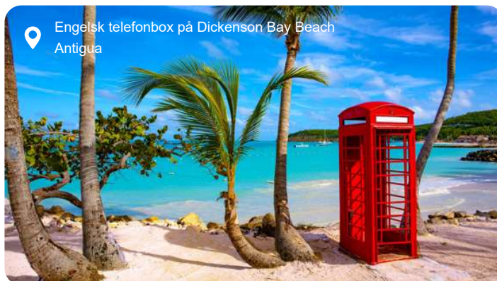
Engelsk telefonbox på Dickenson Bay Beach Antigua

Farverige træhuse med udskårne verandaer, afskallede facader og bliktag i rødt og turkis sætter kulør på St. John's, Antiguas lille, livlige hovedby. Byens centrum er overskueligt og levende, og her finder du både kolonihistoriske bygninger og små lokale museer, som giver et indblik i øens britiske arv og afrocaribiske kultur. I havnen ligger farverige fiskerbåde side om side med store krydstogtskibe, og fra den lille promenade er der udsigt over Det Caribiske Havs klare blå nuancer. Ikke langt fra byen ligger nogle af Antiguas største seværdigheder: Nelson's Dockyard i English Harbour er en velbevaret flådebase fra 1700-tallet, hvor du kan gå mellem gamle stenhuse og mastekraner og få et glimt af livet under Royal Navy. Området er på UNESCO's verdensarvsliste og oser af maritim historie. Kører du videre op ad bjergvejene, når du til Shirley Heights, der er en tidligere udkigspost med storslået udsigt over bugten og havet. Øen er kendt for sine mange strande - faktisk én for hver dag i året, som man siger - og du finder alt fra stille laguner til strækninger med bølger og liv. Antigua er rig på historie, men det er også en ø, hvor rytmen er afslappet, og naturen altid lige om hjørnet.