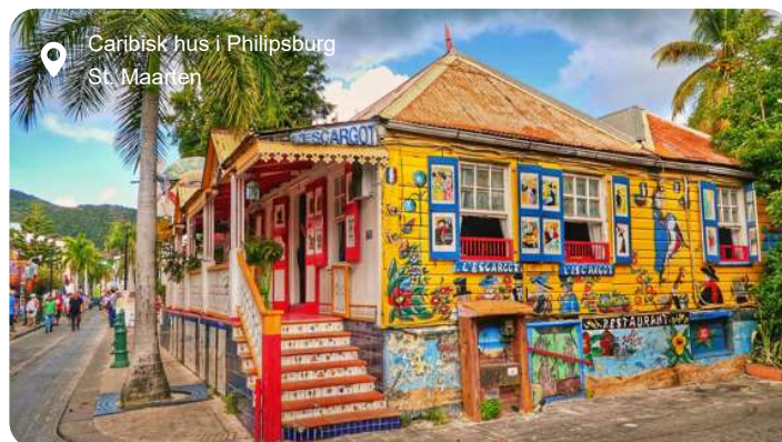
Caribisk hus i Philipsburg St. Maarten

Farvestrålende huse i kolonistil, glitrende butikker og turkisblåt hav danner rammen om Philipsburg, hovedbyen på den hollandske del af St. Maarten. Den kompakte by ligger som en perle mellem to bugter og er let at udforske til fods. Langs strandpromenaden, Boardwalk, venter bløde sandstrande, palmer og caféer, mens Front Street bagved byder på caribisk stemning og toldfri shopping i alt fra smykker til parfume og elektronik. Vil du dykke dybere ned i øens historie, kan du besøge Fort Amsterdam, der blev opført af hollænderne i 1600-tallet og stadig vogter over bugten med kanoner og udsigt. Længere inde i landet lokker de grønklædte bakker og små landsbyer, og på en udflugt kan du opleve både den franske og hollandske del af øen på én dag. Et højdepunkt for mange er et besøg ved Maho Beach, hvor fly fra hele verden lander blot få meter over hovedet på badegæster - en oplevelse, der er lige dele adrenalinus og turistmagi. Øen rummer også rolige laguner, kreolske fiskeretter og små kunstgallerier, og trods sin beskedne størrelse føles St. Maarten som en hel lille verden - med kontraster, charme og caribisk lethed.