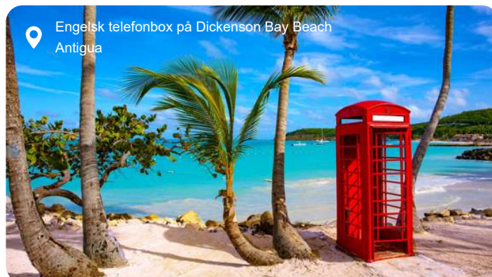
Engelsk telefonbox på Dickenson Bay Beach Antigua

Farverige træhuse med udskårne verandaer, afskallede facader og bliktag i rødt og turkis sætter kulør på St. John's, Antiguas lille, livlige hovedby. Byens centrum er overskueligt og levende, og her finder du både kolonihistoriske bygninger og små lokale museer, som giver et indblik i øens britiske arv og afrocaribiske kultur. I havnen ligger farverige fiskerbåde side om side med store krydstogtskibe, og fra den lille promenade er der udsigt over Det Caribiske Hav klare blå nuancer. Ikke langt fra byen ligger nogle af Antiguas største seværdigheder: Nelson's Dockyard i English Harbour er en velbevaret flådebase fra 1700-tallet, hvor du kan gå mellem gamle stenhuse og mastekraner og få et glimt af livet under Royal Navy. Området er på UNESCO's verdensarvsliste og oser af maritim historie. Kører du videre op ad bjergvejene, når du til Shirley Heights, der er en tidligere udkigspost med storslået udsigt over bugten og havet. Øen er kendt for sine mange strande - faktisk én for hver dag i året, som man siger - og du finder alt fra stille laguner til strækninger med bølger og liv. Antigua er rig på historie, men det er også en ø, hvor rytmen er afslappet, og naturen altid lige om hjørnet.