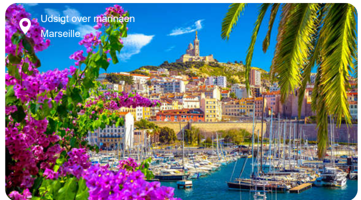
Udsigt over marnaen Marseille

Marseille er den største havn i Middelhavet og Frankrigs andenstørste by. Den er en sand smeltedigel af forskellige folk og kulturer og anses for at være en bro mellem Europa og Nordafrika. Det er en by, der er perfekt til bare at vandre omkring og indsnuse atmosfæren, mens man beundrer de arkitektoniske perler. I den maleriske gamle havn ligger yachts- og fiskerbåde side om side, og lige nord herfor finder du den historiske del af byen, Le Panier, hvis virvar af snørklede og stejle gader gemmer på små, skjulte pladser og gamle, høje huse med terrasser, hvor vasketøjet hænger til tørre. Ud for kysten domineres vignet af det berygtede Château d'If – fængslet på en lille klippeø, hvorfra Greven af Monte Cristo flygtede i Alexandre Dumas' berømte roman. Fra Marseille kan du også udforske smukke og historisk interessante Arles og pavernes gamle by Avignon.