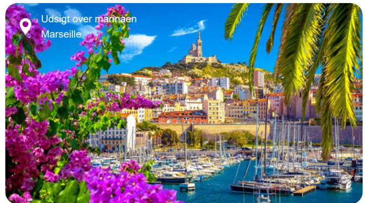
Udsigt over marnaen Marseille

Marseille er den største havn i Middelhavet og Frankrigs andenstørste by. Den er en sand smeltedigel af forskellige folk og kulturer og anses for at være en bro mellem Europa og Nordafrika. Det er en by, der er perfekt til bare at vandre omkring og indsnuse atmosfæren, mens man beundrer de arkitektoniske perler. I den maleriske gamle havn ligger yachts- og fiskerbåde side om side, og lige nord herfor finder du den historiske del af byen, Le Panier, hvis virvar af snørklede og stejle gader gemmer på små, skjulte pladser og gamle, høje huse med terrasser, hvor vasketøjet hænger til tørre. Ud for kysten domineres vyet af det berygtede Château d'If – fængslet på en lille klippeø, hvorfra Greven af Monte Cristo flygtede i Alexandre Dumas' berømte roman. Fra Marseille kan du også udforske smukke og historisk interessante Arles og pavernes gamle by Avignon.