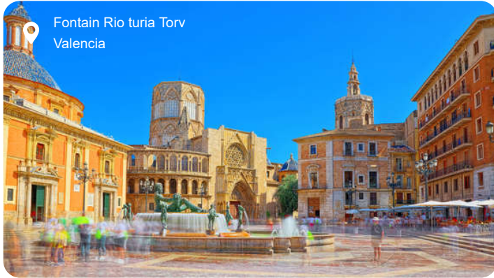
Fontain Rio turia Torv Valencia