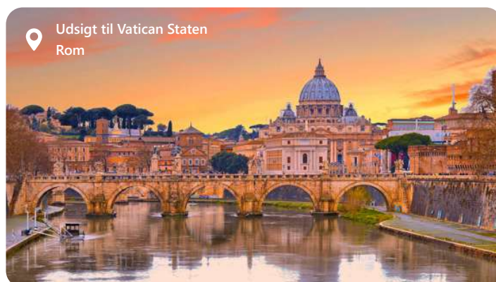
Udsigt til Vatican Staten Rom