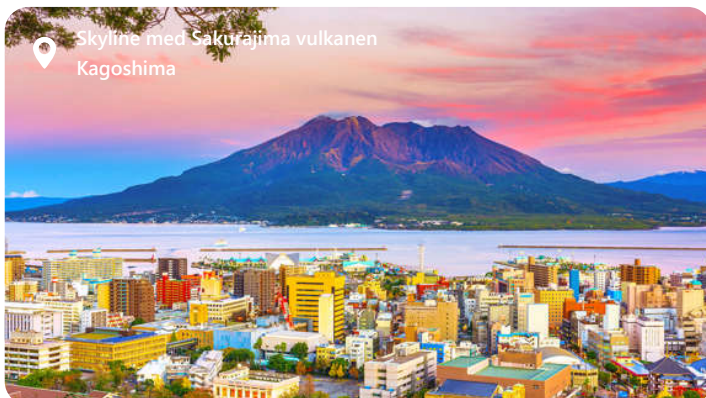
Skyline med Sakurajima vulkanen Kagoshima

med sine skyskrabere. Shopping i byens gader og markeder er en fryd for enhver shoppingsentusiast, og maden spænder fra autentiske gadekøkkener til fine spisesteder. Uanset om du udforsker de travle gader eller slapper af i en af byens smukke parker, vil Shanghai helt sikkert forbløffe dig med sin kontrastfyldte skønhed.