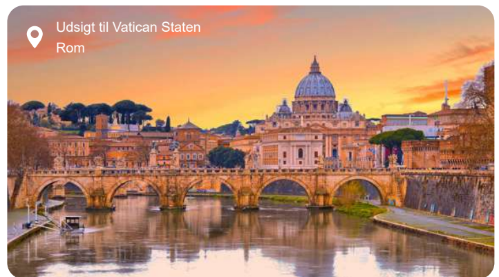
Udsigt til Vatican Staten Rom