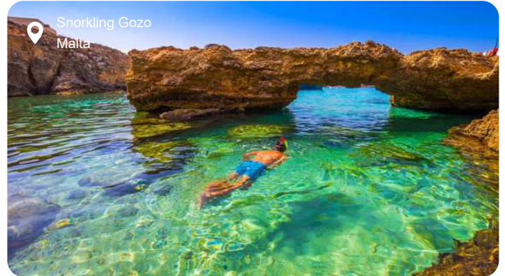
Snorkling Gozo Malta

Malta er en lille øgruppe bestående af 7 øer, hvoraf de 3 – hovedøen Malta samt Gozo og Comino – er beboet. Med sin strategiske beliggenhed mellem Nordafrika og Italien har Malta igennem århundreder været eftertragtet jord, og herredømmet over øerne har skiftet hænder flere gange igennem historien, hvilket har sat sit præg på både sproget, gastronomien og arkitekturen. Maltesisk er således afledt af arabisk blandet med italiensk, mens middelhavskøkkenet blandes med det nordafrikanske. Malteserne er også meget stolte af de legendariske riddere, der forsvarede øen mod tyrkerne og lancerede korstogene. Disse riddere går under mange navne, hvoraf Johanniterordenen og Malteserordenen er de mest kendte. Det var en af ordenens stormestre, der grundlagde Valletta og gjorde byen til hovedstad i midten af 1500-tallet, og mange af byens for øvrigt meget smukke barokke bygninger stammer fra denne tid. På trods af sin beskedne størrelse er Valletta spækket med historisk interessante seværdigheder, hvoraf den imponerende katedral og Stormesterens Palads skal fremhæves sammen med et par museer, der fortæller den spændende historie om ridderne og deres bedrifter. Valletta, der er Europas sydligste og EU's mindste hovedstad, er optaget på UNESCO's Verdensarvsliste, og den er en yderst betagende by at vandre rundt i, da den emmer af historie og romantik.